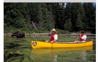
Kanufahrt Algonquin Park